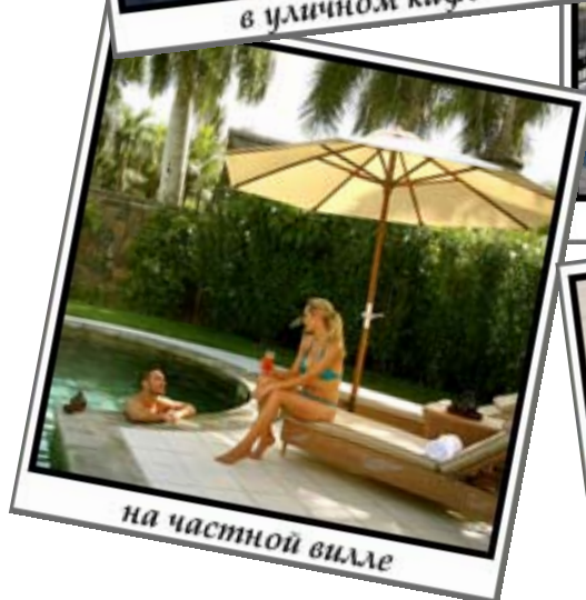
на частной вилле