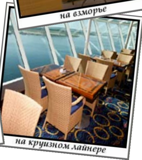
на круизном лайнере