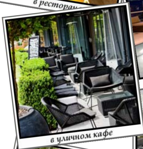
в уличном кафе