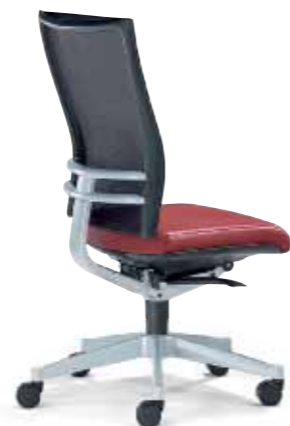
Klöber Orbit Network orb88 Drehsessel. Glasfaserverstärkter Trägerrahmen mit Softnet-Bespannung. Alu-Rückenlehnenträger und -Fußkreuz alu-farbig. Klöber Orbit Network orb88 swivel chair. Glass-fibre reinforced supporting frame with Softnet mesh. Aluminium backrest frame and aluminium-coloured base.