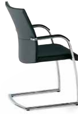
Klöber Orbit orb56 Freischwinger. Rücken vollumpolstert. Armlehnen mit Lederauflage. Ovalrohr-Gestell hochglanz verchromt. Klöber Orbit orb56 cantilever chair. Fully-upholstered backrest. Armrests with leather finish. Oval-tube steel frame, polished chrome finish.