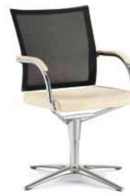
Klöber Orbit Network orb80 Konferenz-Drehsessel mit Softnet-Rückenlehne, Armlehnen mit Lederauflage. Rundrohrgestell hochglanz verchromt. 4-strahliges Fußkreuz alu-poliert, mit Gleitern. Rückholmechanik. Klöber Orbit Network orb80 conference swivel chair with softnet backrest, padded leather armrests. Tubular steel frame with polished chrome finish. With 4-star base in polished aluminium on glides. Auto-return mechanism.