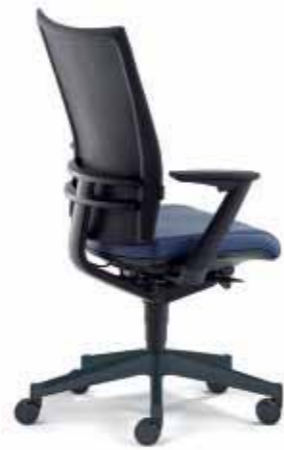
Klöber Orbit orb98 Drehsessel. Glasfaserverstärkter Trägerrahmen mit TPE-Membran. Alu-Rückenlehnenträger schwarz, Z-Armlehnen, Alu-Fußkreuz schwarz. Klöber Orbit orb98 swivel chair. Glass-fibre reinforced supporting frame with TPE membrane. Aluminium backrest frame, black, Z armrests, aluminium base, black.