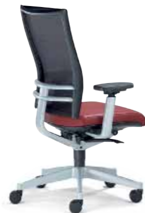
Klöber Orbit Network orb88 Drehsessel. Glasfaserverstärkter Trägerrahmen mit Softnet-Bespannung. Alu-Rückenlehnenträger, MF-Armsupports und Alu-Fußkreuz alu-farbig. Klöber Orbit Network orb88 swivel chair. Glass-fibre reinforced supporting frame with Softnet mesh. Aluminium backrest frame, MF arm supports and aluminium-coloured base.