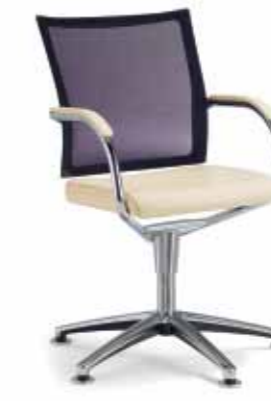
Klöber Orbit Network orb80 Konferenz-Drehsessel auf Gleitern. Softnet-Rückenlehne. Armlehnen mit Kunststoff-Auflage schwarz, Armauflage optional Leder oder Buche. Rundrohr-Gestell hochglanz verchromt. Rückholmechanik. Klöber Orbit Network orb80 conference swivel chair on glides. Softnet backrest. Armrests with black plastic finish, arm supports optionally with leather or beech finish. Tubular steel frame with polished chrome finish. Auto-return mechanism.