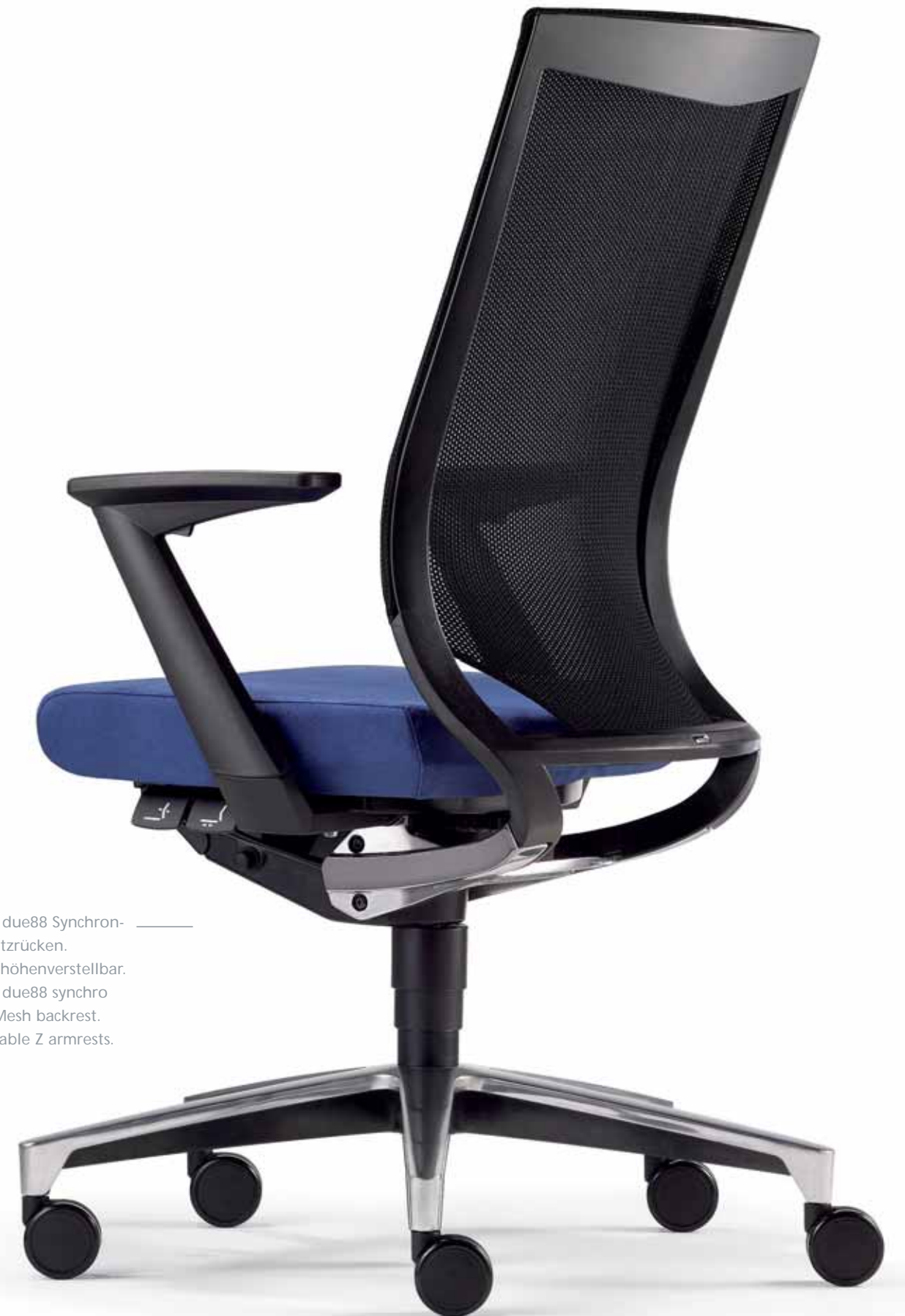
Klöber Duera due88 Synchron-Drehstuhl. Netzrücken. Z-Armlehnen höhenverstellbar. Klöber Duera due88 synchro swivel chair. Mesh backrest. Height-adjustable Z armrests.

In Sekundenschnelle eingestellt auf richtiges und bequem abgestütztes Sitzen. Adjusted to the correct, supported and comfortable seating position within a matter of seconds.