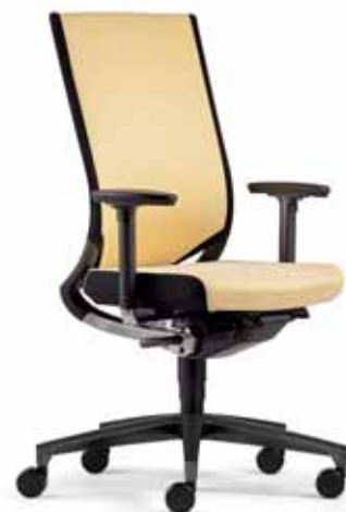
Klöber Duera due98 Synchron-Drehstuhl. Netzrücken mit Polsterauflage, Sitz mit schwarz abgesetzten Seiten. 3D-Armsupports. Alu-Fußkreuz schwarz. Klöber Duera due98 synchro swivel chair. Padded mesh backrest, seat with contrasting black sides. 3D Arm Supports. Black aluminium base.

Armlehnen-Varianten: Z-Armlehnen (3553), optional zusätzlich mit Lederauflage (3573). 3D-Armsupports (3548), optional zusätzlich mit Lederauflage (3588). 4F-Armsupports schwarz (3557), schwarz mit Lederauflage (3577), alu-farbig (3558), alu-farbig mit Lederauflage (3578), poliert (3559), poliert mit Lederauflage (3579). 4F-Armsupports mit Stylingkappe (Duera24) poliert (3659), poliert mit Lederauflage (3679). MF-Armsupports schwarz (3567), alu-farbig (3568), poliert (3569). MF-Armsupports mit Stylingkappe (Duera24) poliert (3669). Die Freischwinger sind in den Gestellfarben verchromt, alu-farbig oder schwarz lieferbar. Der Sitz ist bei allen Modellen serienmäßig einfarbig. Optional mit schwarz abgesetzten Seiten in Stoff Malta 0514 bzw. in Leder schwarz.