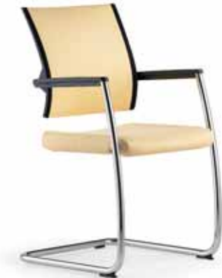
Klöber Duera due56 Freischwinger. Netzrücken mit Polsterauflage. Auch mit Netzrücken schwarz (Duera due46). Armlehnen mit Softauflage, schwarz. Gestell verchromt. Mit Kufengleitern. Klöber Duera due56 Cantilever chair. Mesh backrest with padding. Also with mesh backrest, black (Duera due46). Armrests with soft finish, black. Chrome-plated frame. With glides.

Armlehnen-Varianten: Z-Armlehnen (3553), optional zusätzlich mit Lederauflage (3573). 3D-Armsupports (3548), optional zusätzlich mit Lederauflage (3588). 4F-Armsupports schwarz (3557), schwarz mit Lederauflage (3577), alu-farbig (3558), alu-farbig mit Lederauflage (3578), poliert (3559), poliert mit Lederauflage (3579). 4F-Armsupports mit Stylingkappe (Duera24) poliert (3659), poliert mit Lederauflage (3679). MF-Armsupports schwarz (3567), alu-farbig (3568), poliert (3569). MF-Armsupports mit Stylingkappe (Duera24) poliert (3669). Die Freischwinger sind in den Gestellfarben verchromt, alu-farbig oder schwarz lieferbar. Der Sitz ist bei allen Modellen serienmäßig einfarbig. Optional mit schwarz abgesetzten Seiten in Stoff Malta 0514 bzw. in Leder schwarz.