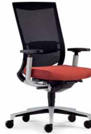
Klöber Duera due88 Synchron-Drehstuhl. Netzrücken schwarz mit Lordosestütze. 4F-Armsupports alu-farbig. Alu-Fußkreuz alu-farbig. Klöber Duera due88 synchro swivel chair. Black mesh backrest with lumbar support. Aluminium-coloured 4F Arm Supports. Aluminium-coloured base.

Für den 24-Stunden-Einsatz: For 24-hour use: