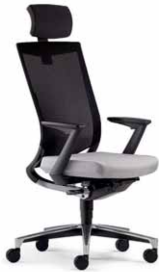
Klöber Duera due89 Synchron-Drehstuhl. Mit neig- und höhenverstellbarer Kopfstütze. Netzrücken schwarz. Z-Armlehnen. Alu-Fußkreuz poliert. Klöber Duera due89 synchro swivel chair. With tilting and height-adjustable headrest. Black mesh backrest. Z armrests. Polished aluminium base.