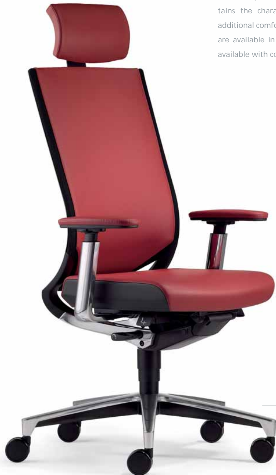
Klöber Duera due99 Synchron-Drehstuhl mit Kopfstütze. Meshrücken mit Polsterauflage. 4F-Armsupports mit Lederauflage. Klöber Duera due99 synchro swivel chair with headrest. Mesh backrest with padding. 4F Arm Supports with leather cover.