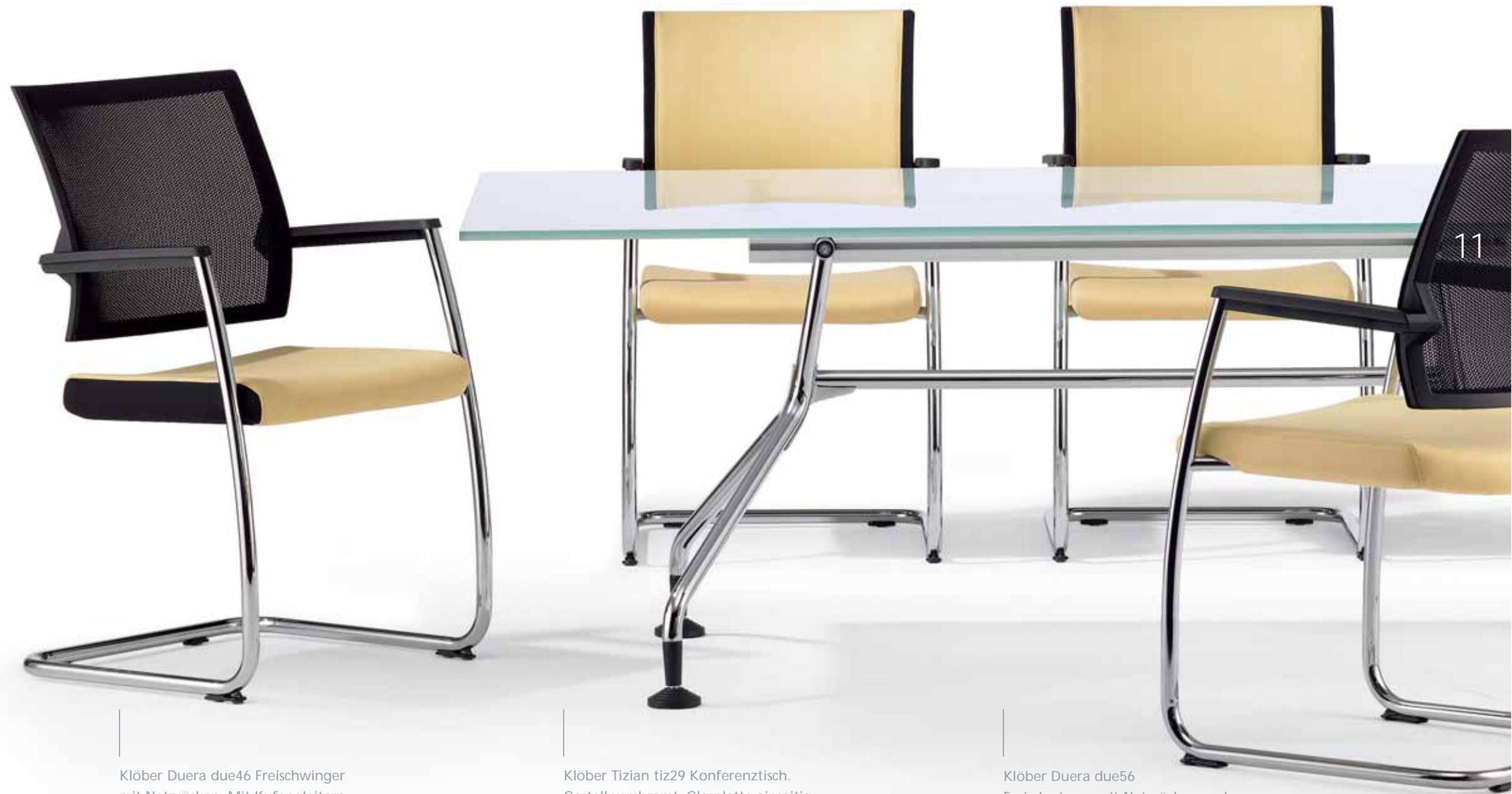
Klöber Duera due46 Freischwinger mit Netzrücken. Mit Kufengleitern. Klöber Duera due46 cantilever chair with mesh backrest. With glides.

How to turn visitors into satisfied guests. The cantilever chair is designed as ergonomically as the Duera swivel chair. The backrest is mounted on swivel bearings, enabling dynamic seating with full freedom of movement. The mesh backrest, that is anchored on all four sides, supports the back in every seated position. The cantilever model is designed to complement the swivel chair.