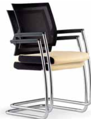
Klöber Duera due46 Freischwinger, stapelbar. Netzrücken. Armlehnen mit Softauflage, schwarz. Gestell verchromt. Klöber Duera due46 cantilever chair, stackable. Mesh backrest. Armrests with soft finish, black. Chrome-plated frame.