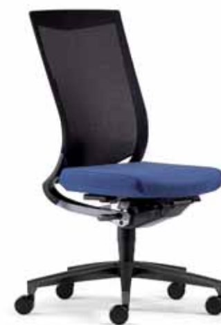
Klöber Duera due88 Synchron-Drehstuhl. Netzrücken schwarz. Alu-Fußkreuz schwarz. Klöber Duera due88 synchro swivel chair. Black mesh backrest. Black aluminium base.