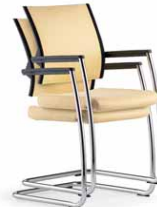
Klöber Duera due56 Freischwinger, stapelbar. Netzrücken mit Polsterauflage. Armlehnen mit Softauflage, schwarz. Gestell verchromt. Mit Kufengleitern. Klöber Duera due56 cantilever chair, stackable. Padded mesh backrest. Armrests with soft finish, black. Chrome-plated frame. With glides.

Armrest variants: Z-armrests (3553), also with leather finish as an option (3573). 3D Arm Supports (3548), also with leather finish as an option (3588). 4F Arm Supports black (3557), black with leather finish (3577), aluminium-coloured (3558), aluminium-coloured with leather finish (3578), polished (3559), polished with leather finish (3579). 4F arm supports with cover sleeve (Duera24) polished (3659), polished with leather padding (3679). MF Arm Supports black (3567), aluminium-coloured (3568), polished (3569). MF arm supports with cover sleeve (Duera24) polished (3669). The cantilever models are available with a chrome-plated, aluminium-coloured or black frame. The seat is one-colour as standard for all models. It is optionally available with contrasting black sides in Malta 0514 fabric or in black leather.