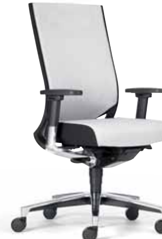
Klöber Duera24 due92 Synchron-Drehstuhl. Auch mit neig- und höhenverstellbarer Kopfstütze (Duera24 due93). Netzrücken mit Polsterauflage, Komfort-Sitz, 4F-Armsupports poliert mit Stylingkappe. Alu-Fußkreuz poliert. Klöber Duera24 due92 synchro swivel chair. Also with tilting and height-adjustable headrest (Duera24 due93). Mesh backrest with padding, comfort seat, 4F arm supports, polished, with cover sleeve. Polished aluminium base.

Für den 24-Stunden-Einsatz: For 24-hour use: