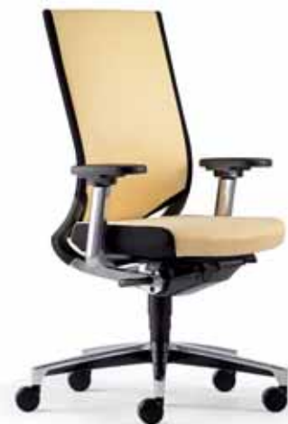
Klöber Duera due98 Synchron-Drehstuhl. Netzrücken mit Polsterauflage und Lordosestütze. MF-Armsupports poliert. Alu-Fußkreuz poliert. Klöber Duera due98 synchro swivel chair. Padded mesh backrest with lumbar support. Polished MF Arm Supports. Polished aluminium base.