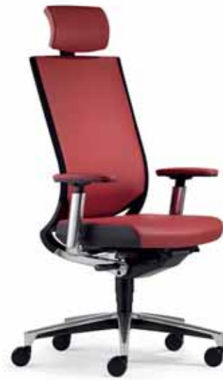
Klöber Duera due99 Synchron-Drehstuhl. Mit neig- und höhenverstellbarer Kopfstütze. Netzrücken mit Polsterauflage. 4F-Armsupports poliert mit Lederauflage. Alu-Fußkreuz poliert. Klöber Duera due99 synchro swivel chair. With tilting and height-adjustable headrest. Padded mesh backrest. Polished 4F Arm Supports with leather finish. Polished aluminium base.