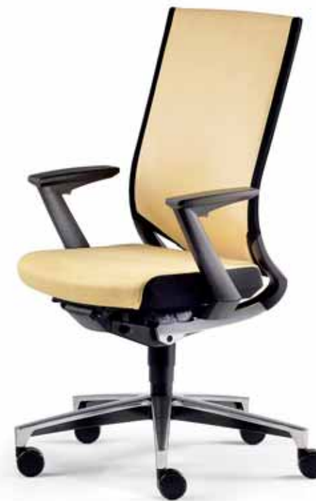
Klöber Duera due98 Synchron-Drehstuhl. Meshrücken mit Polsterauflage, Sitz mit schwarz abgesetzten Seiten. Z-Armlehnen höhenverstellbar. Klöber Duera due98 synchro swivel chair. Mesh backrest with padding, seat with contrasting black sides. Height-adjustable Z armrests.