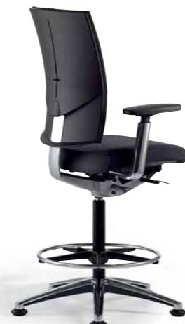
Klöber Cato cat98 Counterstuhl mit Gleitern und Fußring. Hohe Rückenlehne, 4F-Armsupports poliert, Alu-Fußkreuz poliert.

Klöber Cato cat97 synchro swivel chair. Black polyamide base (Code 3221, optional).