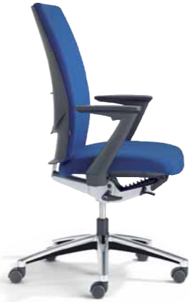
Klöber Cato cat98 Synchron-Drehstuhl. Hohe Rückenlehne, Z-Armlehnen, Alu-Fußkreuz poliert.

Klöber Cato cat99 synchro swivel chair with headrest. 3D Arm Supports, aluminium-coloured finish base.