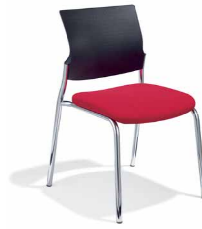
Klöber Cato cat57 Vierbeiner. Kunststoff-Rücken. Gestell verchromt. Stapelbar. Ohne Armlehnen.

Klöber Cato cat98 counter chair with glides and base ring. High backrest, 4F Arm Supports, polished aluminium base.