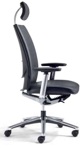
Klöber Cato cat99 Synchron-Drehstuhl mit Kopfstütze. 4F-Armsupports poliert, Alu-Fußkreuz poliert.

Klöber Cato cat99 synchro swivel chair with headrest. Polished 4F Arm Supports, polished aluminium base.