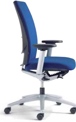
Klöber Cato cat98 Synchron-Drehstuhl. Hohe Rückenlehne, MF-Armsupports alu-farbig, Alu-Fußkreuz alu-farbig.

Klöber Cato cat98 synchro swivel chair. High backrest. Z-armrests, polished aluminium base.