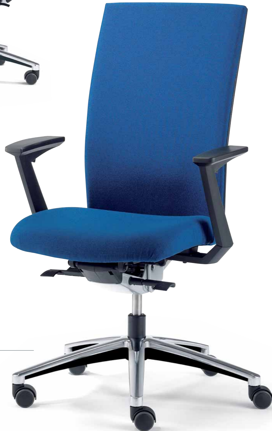
Klöber Cato cat98 Synchron-Drehstuhl. Hohe Rückenlehne. Z-Armlehnen höhenverstellbar. Klöber Cato cat98 synchro swivel chair. High backrest. Height-adjustable Z-armrests.