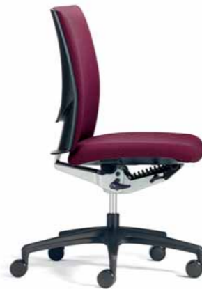
Klöber Cato cat97 Synchron-Drehstuhl. Kunststoff-Fußkreuz schwarz (Code 3221, optional).

Klöber Cato cat97 synchro swivel chair. 3D Arm Supports, black polyamide base.