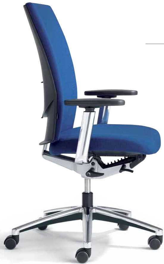
Klöber Cato cat98 Synchron-Drehstuhl. Hohe Rückenlehne. 4F-Armsupports. Klöber Cato cat98 synchro swivel chair. High backrest. 4F Arm Supports.