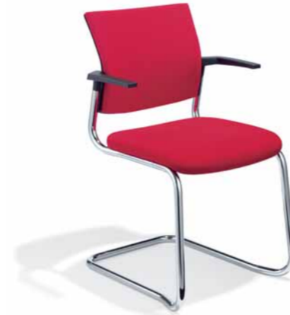
Klöber Cato cat56 Freischwinger. Polster-Rücken. Gestell verchromt. Abb. zeigt Ausführung stapelbar (optional). Armlehnen aus glasfaserverstärktem Kunststoff.

Klöber Cato cat98 synchro swivel chair. High backrest, aluminium-coloured MF Arm Supports, aluminium-coloured base.