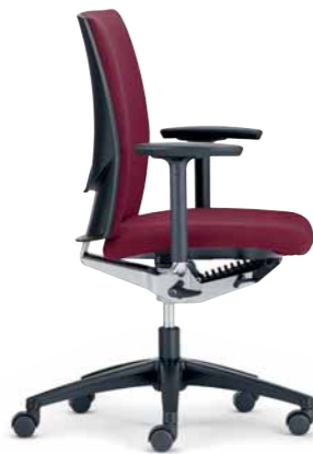
Klöber Cato cat97 Synchron-Drehstuhl. 3D-Armsupports, Kunststoff-Fußkreuz schwarz.

Klöber Cato cat97 synchro swivel chair. Ring armrests, black polyamide base.