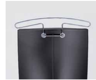
Praktischer Kleiderbügel. Practical coat hanger.

Vollkommener Gleichklang. Die perfekte Synchronmechanik passt den Bewegungsablauf von Sitz und Rückenlehne punktgenau der menschlichen Bewegung an. Vorteile: kein „Hemdauszieh-Effekt“. Und jederzeit optimale Abstützung der Wirbelsäule.