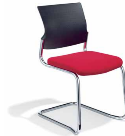
Klöber Cato cat56 Freischwinger. Kunststoff-Rücken. Gestell verchromt. Abb. zeigt Ausführung stapelbar (optional). Ohne Armlehnen.

Klöber Cato cat56 cantilever model. Upholstered backrest. Chrome-plated frame. Picture shows stackable version (optional). Armrests made of fibreglass-reinforced polyamide.