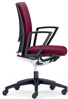
Klöber Cato cat97 Synchron-Drehstuhl. Ring-Armlehnen, Kunststoff-Fußkreuz schwarz.

Klöber Cato Casa cca58 cantilever chair. High, continuous back, upholstered, armrests with plastic finish. Chrome-plated tubular frame. Picture shows stackable version (optional).