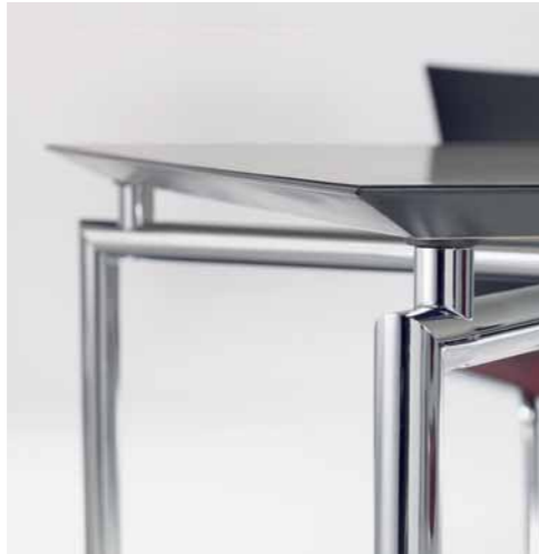
Klöber Carrée car28 Konferenz-Tisch. Gestell verchromt. Köber Carrée car28 conference table. Chrome-plated frame.