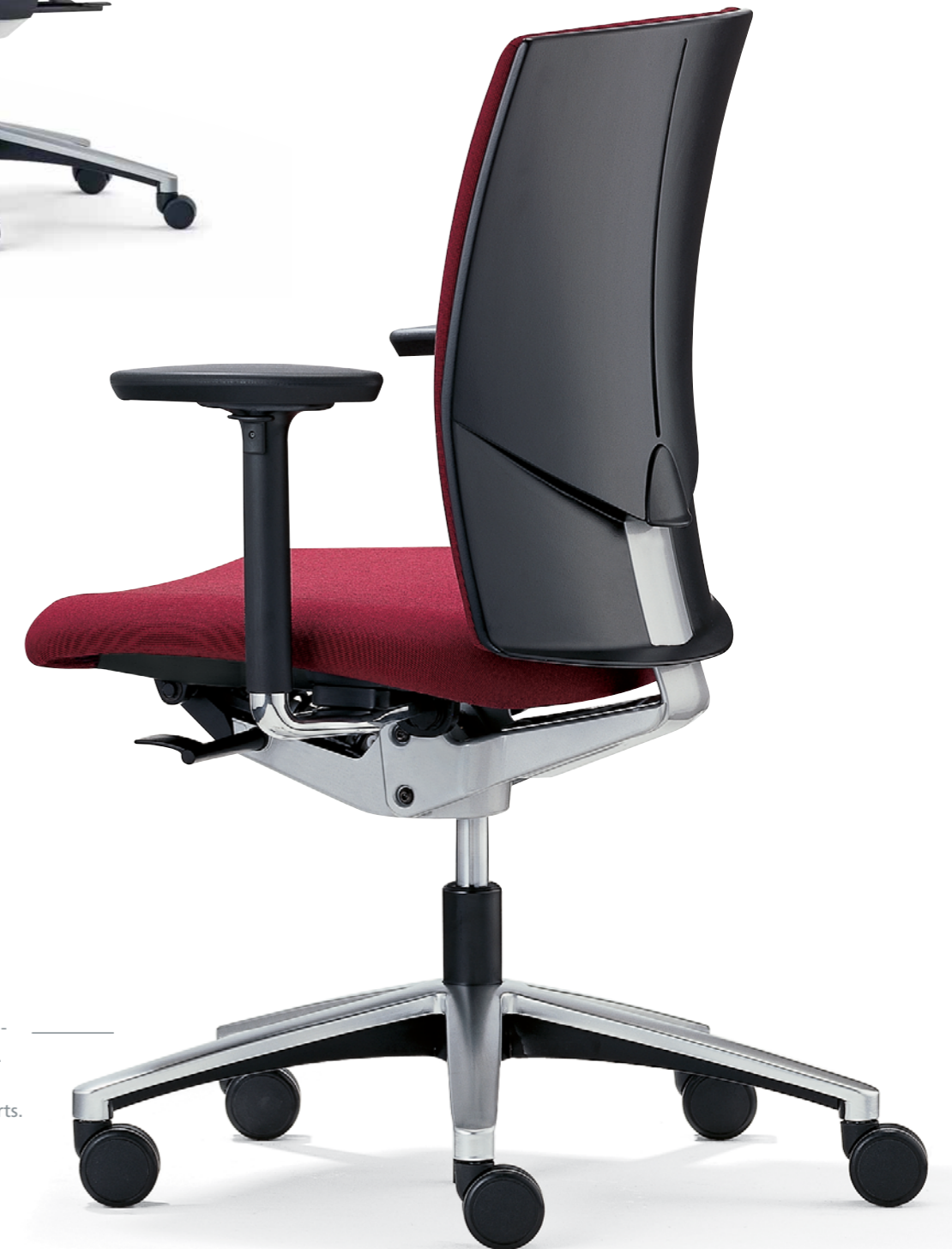
— Klöber Cato cat97 Synchron-Drehstuhl. 3D-Armsupports. Klöber Cato cat97 synchro swivel chair. 3D Arm Supports.