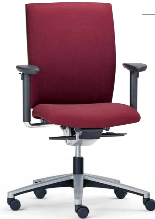
— Klöber Cato cat97 Synchron-Drehstuhl. 3D-Armsupports. Klöber Cato cat97 synchro swivel chair. 3D Arm Supports.

Die einstellbare Sitztiefe und Sitzneigung vermeidet Druckstellen und verbessert die Sauerstoffversorgung. Adjustable seat depth and tilt eliminate pressure points and improve blood supply.