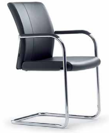
Klöber Cato Casa cca58 Freischwinger. Hoher durchgehender Rücken, umpolstert, Armlehnen mit Kunststoff-Auflage. Rundrohr-Gestell verchromt. Abb. zeigt Ausführung stapelbar (optional).

Klöber Cato cat56 cantilever model. Polypropylene backrest. Chrome-plated frame. Picture shows stackable version (optional). Without armrests.