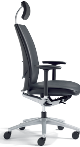
Klöber Cato cat99 Synchron-Drehstuhl mit Kopfstütze. 3D-Armsupports, Alu-Fußkreuz alu-farbig.

Klöber Cato cat99 synchro swivel chair with headrest. Polished 4F Arm Supports, polished aluminium base.