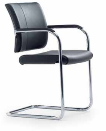
Klöber Cato Casa cca56 Freischwinger. Rücken umpolstert, Armlehnen mit Kunststoff-Auflage. Rundrohr-Gestell verchromt. Abb. zeigt Ausführung stapelbar (optional).

Klöber Cato cat57 four-legged chair. Upholstered backrest. Chrome-plated frame. Stackable. Armrests made of fibreglass-reinforced polyamide.