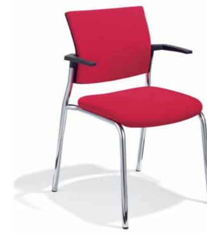
Klöber Cato cat57 Vierbeiner. Polster-Rücken. Gestell verchromt. Stapelbar. Armlehnen aus glasfaserverstärktem Kunststoff.

Klöber Cato cat57 four-legged chair. Polypropylene backrest. Chrome-plated frame. Stackable. Without armrests.