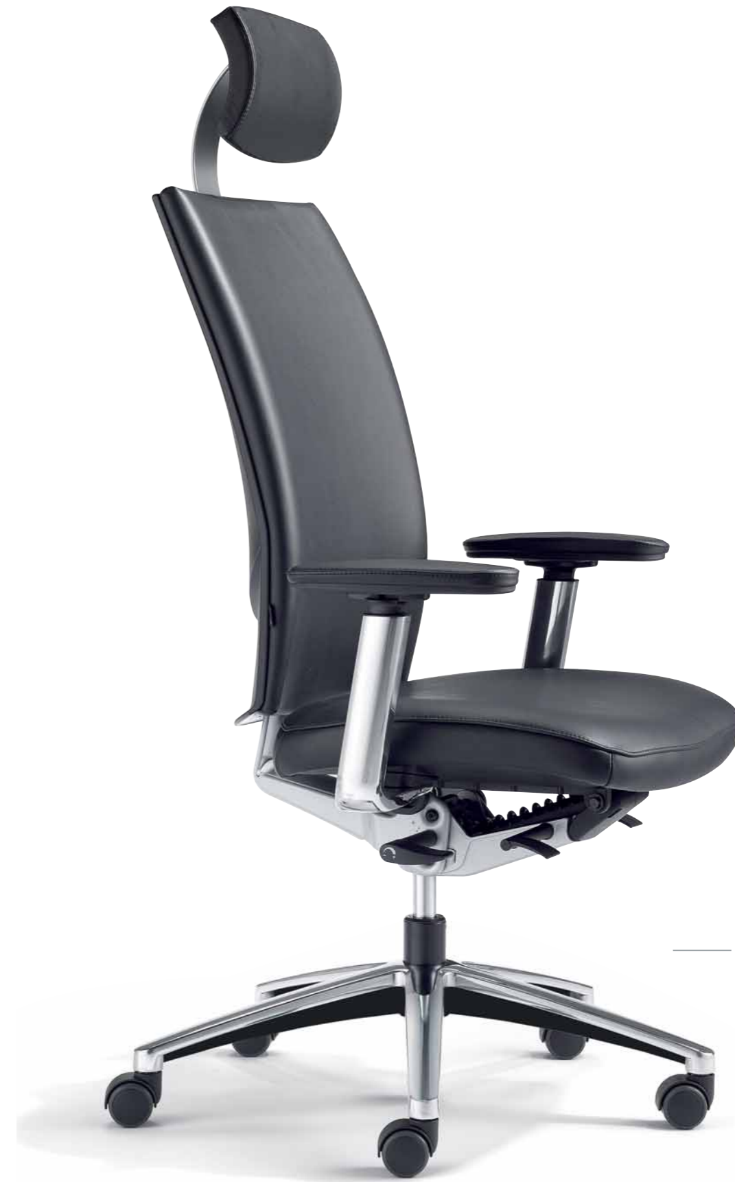
— Klöver Cato cat99 Synchron-Drehstuhl mit Kopfstütze. 4F-Armsupports. Klöver Cato cat99 synchro swivel chair with headrest. 4F Arm Supports.

So einfach wie knöpfen: die patentierte Cato Schnellverstellung zur Einstellung auf das Körpergewicht. As easy as pushing a button: the patented Cato quick-set mechanism allows adjustment to suit the user's body weight.